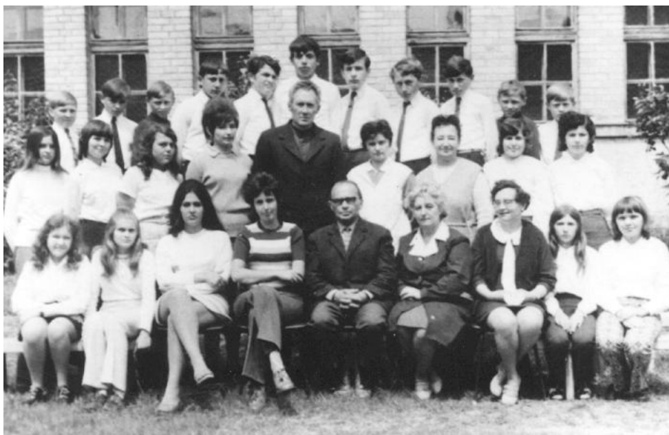
Iskolai csoportkép 1974-ből

is kezdtek tanítani. Oka: részben a várostól való távolság, a kevés fizetés, a lakáshiány, az állam által rosszul fölmért tanítóképzés helyzete, a tanuló-csoport bontása stb. A képesítés nélküli nevelők többsége tanult, hivatásának érezte a tanítói pályát, főiskolát végeztek. Akadtak, akik a megkezdett főiskolát levelező tagozaton folytatták, vagy ott fejezték be.