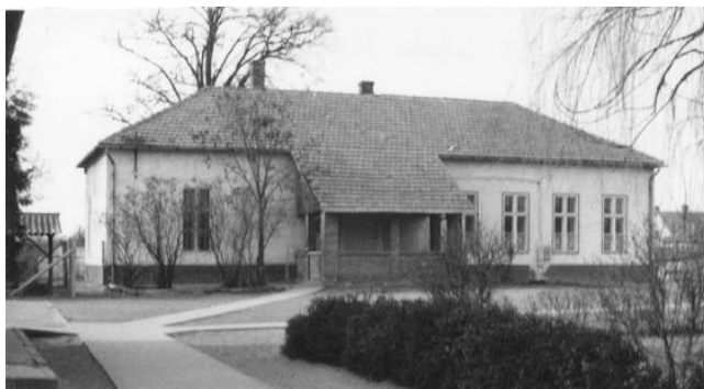
A belsőcsengelei "öreg" iskola

valósult meg. Igen szigorú nevelésben részesültek a gyerekek, ha valaki nem jól teljesített vagy csintalankodott, könnyen kiérdemelte a "körmöst", vagy büntetésként délután kellett plusz feladatokat megoldania. Nem voltak tankönyvek, ha voltak is, akkor azt elődeiktől örökölték. Hátratett kézzel ültek a teremben, és figyelték a tanár előadását. A számoláshoz és íráshoz nem füzetet, hanem palatáblát és a hozzá tartozó irkát használták. A dolgozatfüzeteket nem vitték haza, hanem a felmérőket ebbe írták, és igen sok körmöst lehetett kapni, ha rácsöppent a tinta a füzetre. Amíg a tanár az első osztályosokkal foglalkozott, addig a már írni tudók különböző gyakorló feladatokat kaptak. A második-harmadik osztályosokat gyakran kiküldték a tanterem egyik oldalára, hogy ott folyamatosan mondják a szorzótáblát, és így rögzítsék. Az iskola másik oldalán a negyedik-ötödikeseket rábízta egy jó tanuló nagyobb diákra, aki verseltette vagy énekeltette őket. Sokszor ezek a tanítók a jobb képességű gyerekeket házkörűli munkákra fogták be. Ezt a diákok kitüntetésnek vették, és szívesen segédkeztek a tanító konyháján, vagy kertjében. 20