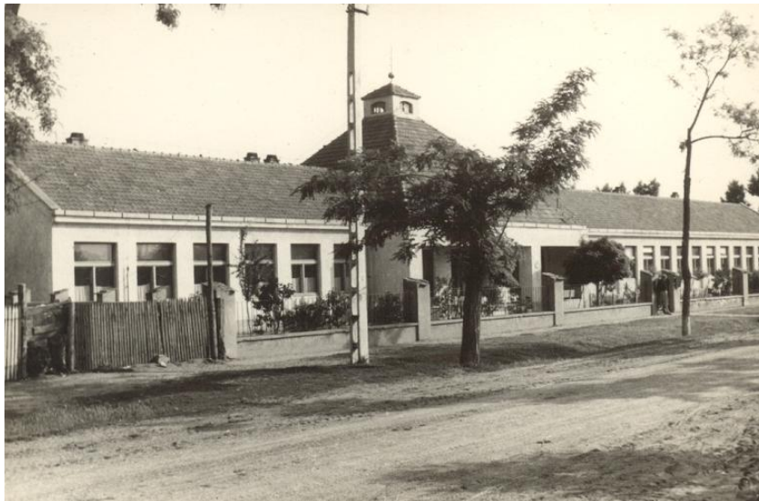
Az új belterületi iskola (bővítés előtt)