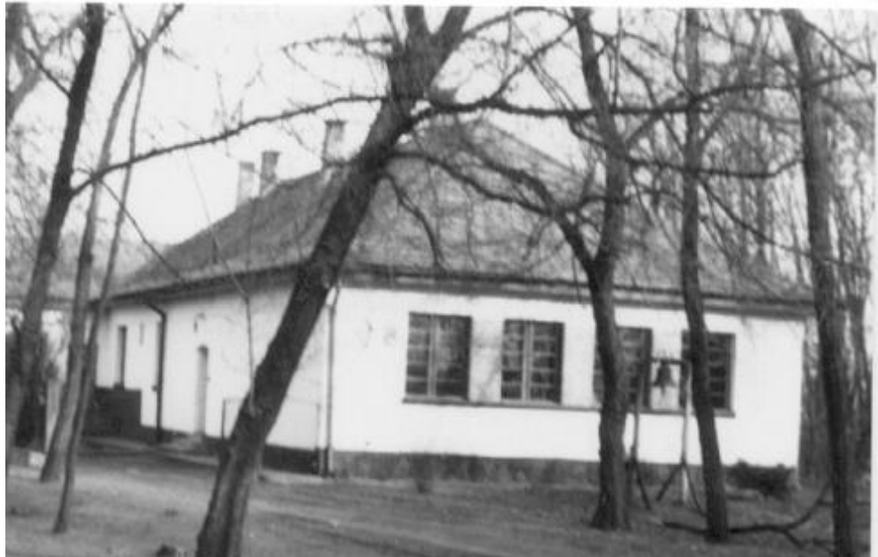
Az Erdősarki iskola

A csengelei iskolák körzetileg 1908-ig Szeged Alsó- és Felsőtanyai Igazgatóságához, 1908-1922 között a Felsőtanyai Igazgatóságához, 1922-1924 között a Felsőközponti Igazgatóságához tartoztak. 1924-ben a vallás- és közoktatási miniszter 1309/1924. VIII. b. számú rendeletére önálló igazgatóság alakult Csengelén, de idecsatolták a felsőközponti Vedresszéki és az Erdőközi iskolát, majd 1933-ban a Szentévi iskolát, melyek 1944-től újra Felsőközpont-hoz tartoztak. 1926-ban megépült az igazgatói iroda és a hozzá tartozó szolgálati lakás is (ma az I. számú háziiorvosi rendelő).