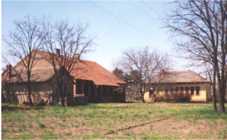
A Pántlika úti iskola