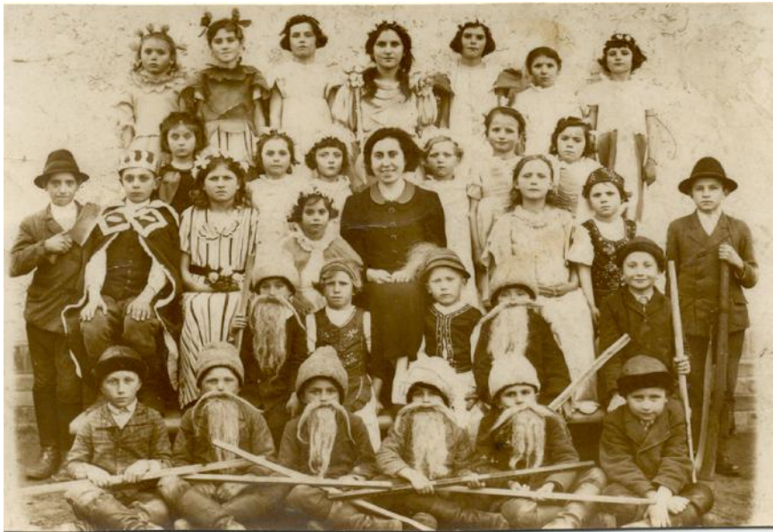
Hófehérke előadás a Templomhalmi iskolában (1939)