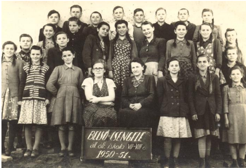
Iskolai csoportkép 1951-ből