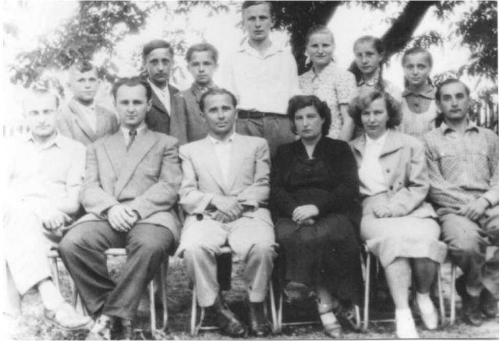
A tantestület 1956-ban (ülő sor)

régiekből csak részleteket válogatva lehetett tanítani. A felszerelések igen hiányosak voltak minden iskolában.