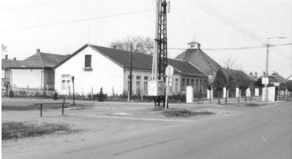
A belterületi iskola az új szárnyal