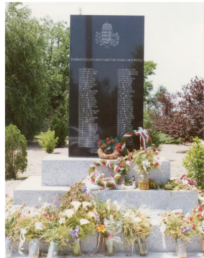
A megvalósult emlékmű