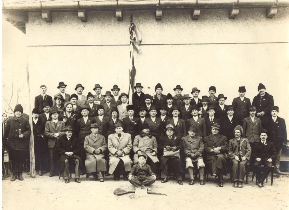
Az egyesület tagsága 1945-ben