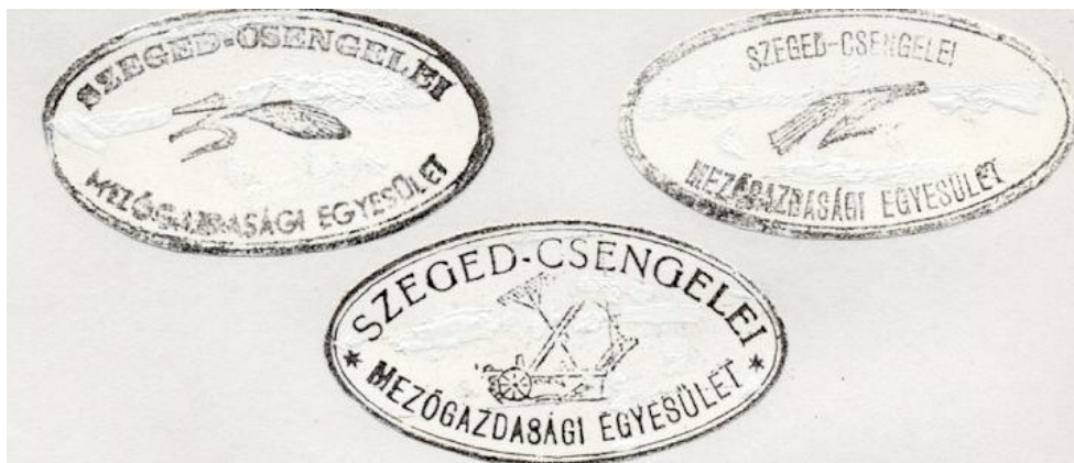
Az egyesület pecsétjei

Az egyesület könyvtárral is rendelkezett, melyből a tagok kölcsönözhatték. A könyvvállomány jelentős részét gazdasági szakkönyvek tették ki (1934-ben a 251 kötetükből 136 volt ilyen). Szerveztek kosárfonó- 3 és börtanfolyamot, valamint közösen szerezték be a növényvédő szereket.