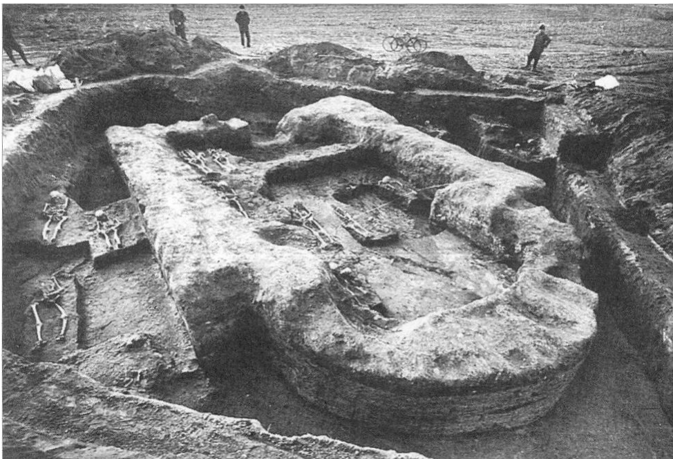
A templomrom feltárás közben

1975. január 24-én az Aranyhomok MGTSZ a központi major mögötti területen, a Bogár-tanya mellett (015/17 helyrajzi számú terület "h" alrészén) homokkitermelést kezdett meg. A munkák beindulásakor azonban emberi csontok kerültek elő, ezért értesítették a szegedi Móra Ferenc Múzeumot. A leletmentést 1975. január 27. - február 11. között végezték dr. Horváth Ferenc irányításával.