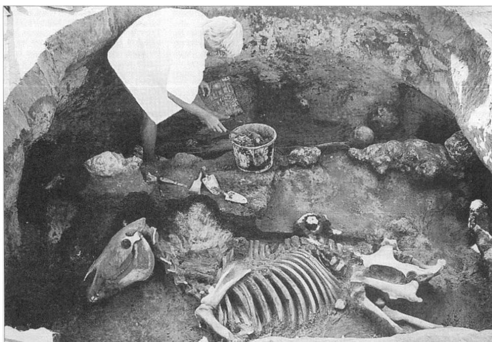
A kun vezéri sír feltárás közben

Az egyik hely Csengele Kelőpatak részén, a Bangó-tanya mellett helyezkedett el. Két évvel ezelőtt ott már régészeti terepbejárást végeztek, így már tudtak a lelőhely létezéséről. Az ásatások során gödrök, árkok és oszloplyukak mellett cserepeket és csontokat találtak, melyből meg lehetett állapítani, hogy a bronzkorban, 2-3 ezer évvel ezelőtt település volt itt. A feltárást a szegedi múzeum munkatársa, Szalontai Csaba vezette.