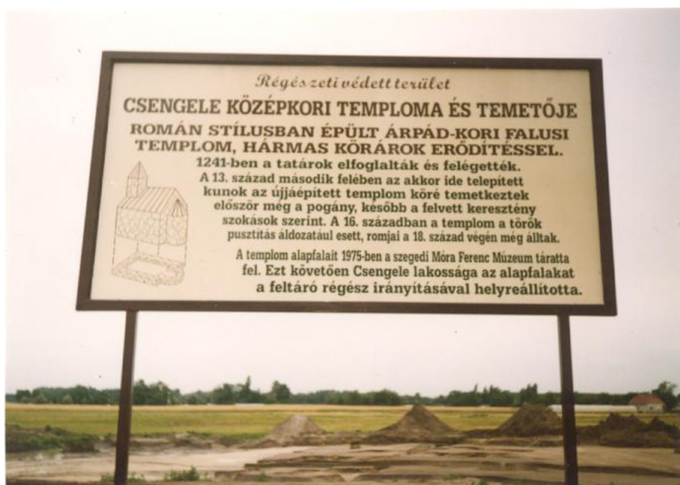
Emléktábla a Bogár-háti templomromnál

A templomban és környékén 38 sírt tártak fel 62 és 162 cm közötti mélységben. A sírok fekvése nagyrészt a templom tengely irányához igazo-