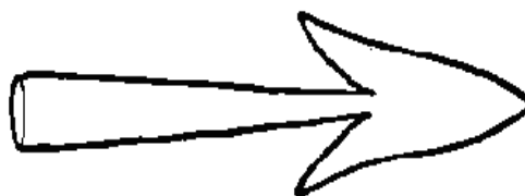
Egy feketealmi avar nyílhegy rajza Kalmár Jánostól

volt. Tizennégy sírban megmaradt mindkettő övcsat, háromban az egyik bronzból készült.